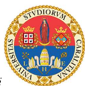
Università degli studi di Cagliari

Sono stati concessi i seguenti patrocini di